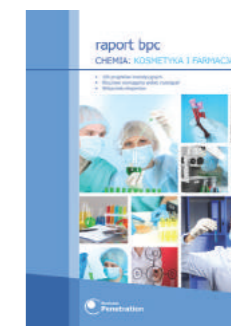
Raport BPC: Kosmetyka i Farmacja