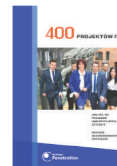
Raport BPC: 400 Projektów IT