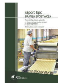
Raport BPC: Branża Spożywcza