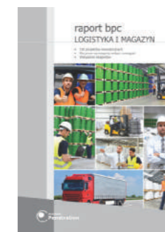
Raport BPC: Logistyka i magazyn