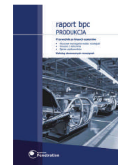
Raport BPC: Produkcja