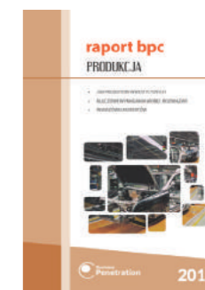
Raport BPC: Produkcja 2015