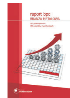
Raport BPC: Branża Metalowa