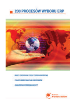
Raport BPC: 200 Procesów Wyboru ERP

Firma konsultingowa Business Penetration & Consulting (BPC) dociera rocznie do ok. 4000 przedsiębiorstw, wspiera kadre zarządzającą w procesie wyboru zaawansowanych rozwiązań informatycznych. W oparciu o pozyskaną wiedzę publikuje Raporty Analityczne BPC o stanie informatyzacji polskich przedsiębiorstw. Publikacje stanowią kompendium wiedzy BPC dla przedsiębiorstw poszukujących zaawansowanych rozwiązań IT. Trafiają do przedsiębiorstw wybranych branż rynku, które rozważają inwestycje w IT. W latach 2013-2014 na rynku przedsiębiorstw MSP i sektora korporacyjnego ukazały się następujące Raporty Analityczne BPC: